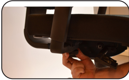
1. Bredd 2. Höjd.